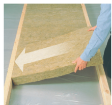
Вставьте плиту одной стороной в каркас

Плиты ЛАЙТ БАТТС с технологией Флекси легко установить в каркас благодаря наличию пружинящего края. Плиту не нужно «подгонять» в конструкцию. Достаточно поджать такой край и плита встает на место, кроме того, компенсируя возможные отклонения от вертикали. Пружинящий край имеет маркировку на торце.