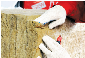
Пружинящий край поджимается и разжимается

Плиты ЛАЙТ БАТТС с технологией Флекси плотно встают в конструкцию каркаса, что позволяет избежать образования «мостиков холода» — между утеплителем и каркасом не образуется щелей. Благодаря этому законченная конструкция надежно удерживает тепло, обеспечивая комфортную атмосферу в помещении и отсутствие сквозняков.