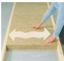
Отпустите плиту и она плотно встанет в каркас