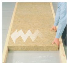
Подожмите пружинящий край и вставьте другую сторону